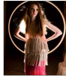
Paola Suhonen Vaatesuunnittelija