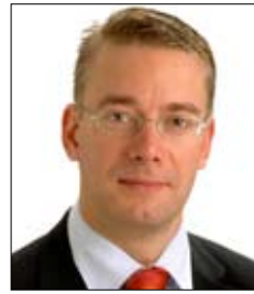
Stefan Wallin Kulttuuriministeri

Graphic designer, Non-fiction writer STUDIO ARVOANTERO Bulevardi 52 B 36 FIN-00120 Helsinki +358 9 608 150, +358 41 5241 678 arvo.vatanen@pronto.fi www.arvovatanen.com