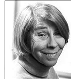
Tove Jansson Kirjailija, taiteilija