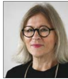
Vuokko Nurmesniemi Akateemikko