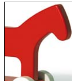
Finn Koni Arvo Vatanen